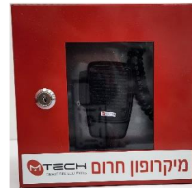
יחידה מיקרופון רחוק