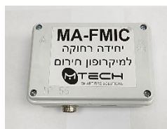
יחידה למיקרופון רחוק